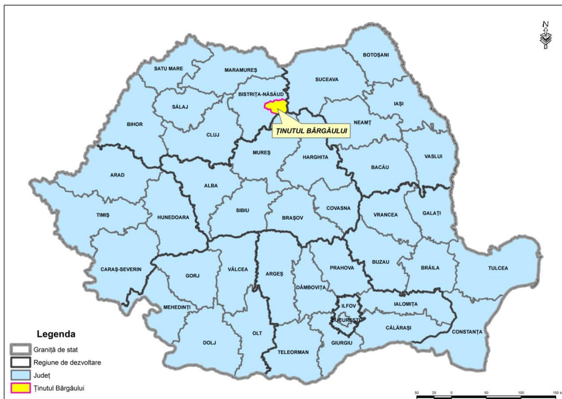
Fig. 1. Ținutul Bârgăului. Încadrarea la nivel național.

Datorită structurii sale complexe, la nivelul sapțiului mental românesc , se pot identifica următoarele nivele aflate într-o strictă ierarhizare : spațiul mental național , spații mentale provinciale , spații mentale etnografice și spații mentale habitajionale ( P., Cocean, N., Ciangă 1999-2000, P., Cocean 2010), la care se adaugă odată cu dezvoltarea orașelor mari, a capitalelor și spațiile mentale metropolitane , asimilabile celor etnografice (P., Cocean, 2010).