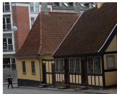
Casa lui Hans Christian Andersen, Odense

Hans Christian Andersen își amintea că fusese învățat să citească de către o bătrână învățătoare care „Se așeza într-un fotoliu, cu spătar înalt aproape de orologiu. Când bătea orele, ceasul declanșa un mecanism ciudat, făcând să defileze prin fața noastră o serie de personaje mici, grozav de amuzante. Învățătoarea avea la îndemână o nuiă cu care croia în