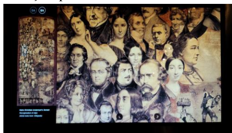
Andersen și contemporanii săi întâlniți în timpul călătoriilor prin Europa Muzeul H. Chr. Andersen Hus, Odense

În opera lui Ion Creangă, elementele autobiografice folosite pentru crearea mărcii monografice constituie un prilej de a demonstra credibilitatea mărturiei adresate publicului. Autorul Amintirilor din copilărie fusese, până în momentul publicării acestei lucrări, cunoscut drept scriitorul Poveștilor , al Povestirilor și al Abecedarului . Amintirile din copilărie oferă indicii referitoare la momentele-cheie ale evoluției spirituale a scriitorului. Caracterul de Bildungsroman al operei exprimă și el această idee.