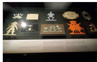
Magia decupării personajelor, Muzeul H. Chr. Andersen Hus, Odense

Jocul cu personajele decupate din hârtie colorată ale teatrului de păpuși va sta la baza inspirației creatoare a scriitorului care și-a păstrat obiceiul de a-și decupa personajele de hârtie înainte de a le așterne povestea în scris: „Rămas singur acasă, mă distrăm cu micul teatru pe care mi-l făurise tata, coseam rochii păpușilor sau citeam piese dramatice.” (Andersen, 1983: 25) „Da, căci în ciuda celor 16 ani ai mei, eram încă un copil neștiutor care se mai juca cu păpușile. În fiecare zi le făceam haine noi și pentru a-mi procura bucățele de stofă de care aveam nevoie, mă duceam să cer eşantioane de mătase în magazinele din