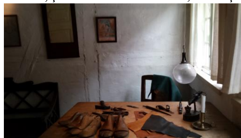
Camera cu unelte de lucru ale tatălui lui Hans Christian Andersen, Muzeul H. Chr. Andersen Hus, Odense

În Povestea vieții mele , Hans Christian Andersen își amintește cu emoție anii copilăriei: „În 1805 trăia la Odense, într-o modestă cămăruță, o pereche de tineri căsătoriți, care se iubeau tare mult. El, în vârstă de vreo 22 de ani, cizmar, era un om înzestrat și avea o fire de poet. Ea, cu câțiva ani mai mare, femeie simplă și necunosătoare în ale vieții, avea o inimă minunată. Ajuns de curând lucrător,