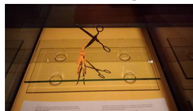
Magia decupării personajelor Muzeul H. Chr. Andersen Hus, Odense