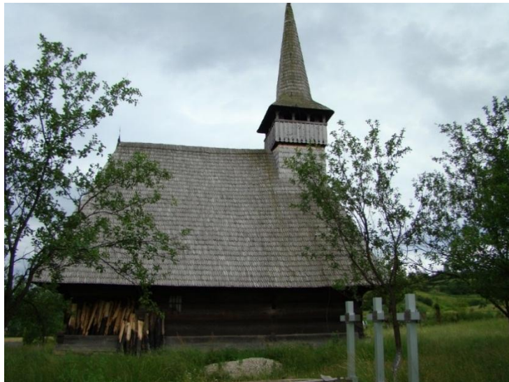
Fig 4. Biserica de lemn Sfinții Arhangheli Mihail și Gavril Ungureni 1760 - sursa http://mariosolomon.tripod.com/

Biserica de lemn “Sfinții Arhangheli Mihail și Gavril” din Ungureni a fost ctitorită în 1760 și este renumită pentru construcția ei din lemn de frasin. Biserica deține o colecție de icoane pe lemn și de picturi păstrate parțial până în prezent, ceea ce face clasarea acestei biserici pe lista monumentelor istorice.