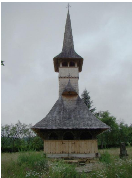
Fig 3. Biserica de lemn Adormirea Maicii Domnului 1757 Cărpiniș

Biserica de lemn Adormirea Maicii Domnului din Cărpiniș , care aparține comunei Copalnic Mănăstur , a fost fondată în anul 1757 și este și aceasta pe lista monumentelor istorice.