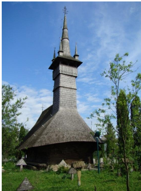
Fig. 1 Biserica de lemn Sf. Arhangheli Mihail și Gavril, Rogoz – sursa http://mariosolomon.tripod.com/

Biserica de lemn Adormirea Maicii Domnului din Lăpuș , unele surse spun că datează încă din secolul 15, din anul 1437, fiind cea mai veche Biserica de lemn din zonă. Mai apoi, în anul 1671, se ridică Biserica de lemn Sf. Arhangheli din Libotin. Biserica de lemn Sf. Paraschiva din Rogoz este o biserică greco-catolică și sursele spun că a fost construită după invazia tătarilor în anul 1717 în comuna Suciul de Sus. Ulterior s-a hotărât mutarea ei la Rogoz și amplasarea acesteia în cimitirul satului Rogoz. Biserica este construită din lemn de paltin și ceea ce o face deosebită este faptul că se poate muta în orice parte a lumii, fiind construită în așa mod încât să poată fi montată și demontată fără a se deteriora în vreun fel.