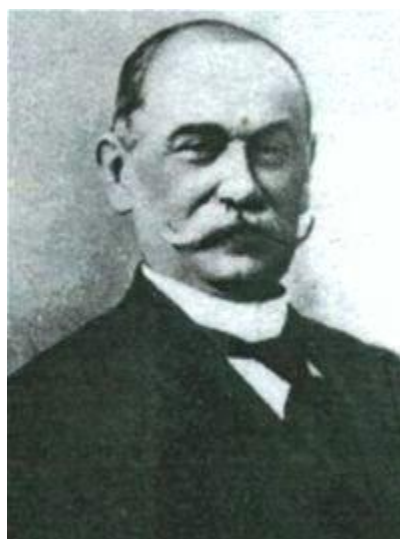
Iosif Vulcan (1841-1907)