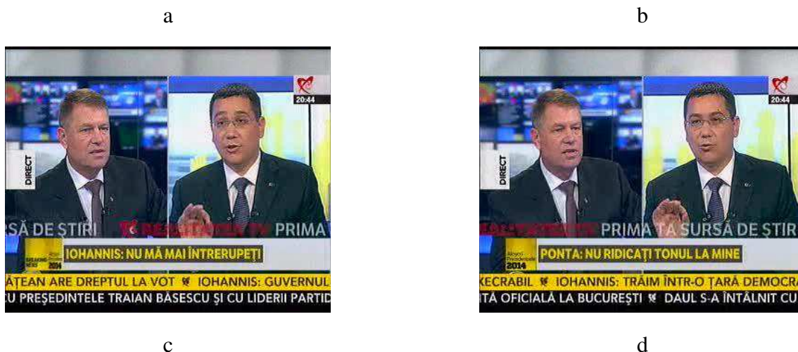
Figura 3. Gesturi pragmatice executate de candidatul Victor Ponta (B1TV, 12 noiembrie 2014, respectiv RealitateaTV, 11 noiembrie 2014): a – gest din familia “mâini împreunate” ( Joined hands (eng.), Praying hands (eng.) sau Mani giunte (it.)); b, c, d – gesturi din familia gesturilor de precizie, de tip “inel” ( ring gestures ) (Kendon, 2004)

Primul gest (vezi Figura 3.a) este executat în timp ce rostește următorul enunț: “Vroiam doar să vă spun un singur lucru”,