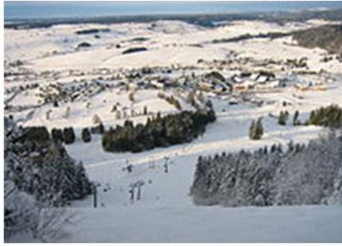
Fig.7. Métabief, station de montagne du Doubs (www.doubs.travel)