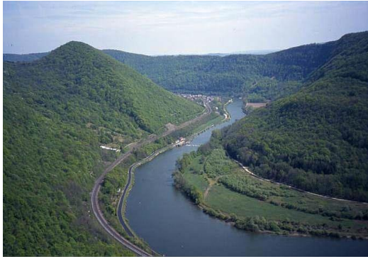
Fig.5. Le Doubs