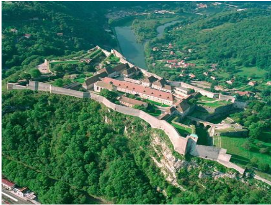
Fig.1. Citadelle de Besançon

parfait. Jadis usine de production de sel et lieu de vie des ouvriers, ce monument prestigieux figure depuis plus de 25 ans au Patrimoine mondial de l'Unesco. Mais cette réalisation majeure de l'architecte visionnaire Claude-Nicolas Ledoux est loin d'être une coquille vide. La maison du Directeur, édifice central, abrite deux expositions permanentes: l'une traitant du sel, l'autre des cités idéales. Quant à la tonnellerie, elle révèle, via de fines maquettes, l'œuvre de Ledoux. Toute l'année, le site accueille diverses expositions, des concerts, des colloques, tandis qu'à la belle saison des jardins originaux et thématiques ravissent les visiteurs.