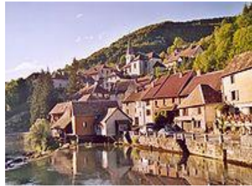
Fig.8. Le village de Lods, membre de l'association Les plus beaux villages de France (www.doubs.travel)

S'il est vrai que la marche et le VTT sont les deux loisirs sportifs préférés des Français, alors il faut qu'ils s'orientent en direction du Doubs. Du sport en trois D, en trois dimensions, en trois Doubs: celui des forêts, des pâturages et alpages, des lacs, des rivières (randonnée, VTT, cyclotourisme, balade équestre, golf, baignade, voile, planche, canoë-kayak, pêche), celui des gorges, des falaises et des grottes (escalade, spéléologie), et celui du ciel (parapente, montgolfière).