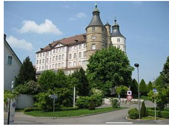
Fig.2. Château de Montbéliard