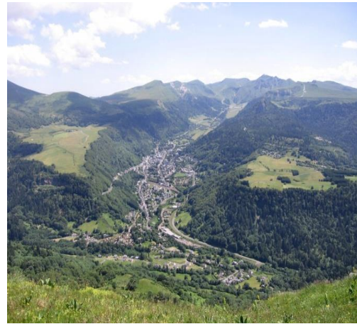
Fig.10. Le Mont d'Or

D'un point de vue plus global et sommaire, le Doubs dispose de: 1 150 km de pistes de ski; nordique; 60 km de ski alpin; 2 300 km de sentiers de petite randonnée; 850 km de sentiers de grande randonnée; 1600 km de sentiers VTT balisé; 50 musées et expositions permanent; 13 châteaux et monument; 3 grotte; 25 églises remarquables.