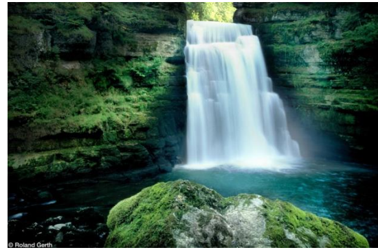
Fig.6. Le saut du Doubs

À la frontière franco-suisse, le sommet du mont d'Or offre un panorama grandiose. Du point culminant du Doubs, à 1 463 mètres, on peut apercevoir la chaîne des Alpes et la plaine suisse s'étendre au pied de falaises vertigineuses. Un spectacle accessible par le télésiège du Morond à Métabief, par la route depuis les Longevilles ou par le nouveau circuit des Crêtes de sept kilomètres ponctué de tables thématiques: le belvédère des chamois, la formation des alpages et la vue panoramique du mont d'Or, de toute beauté.