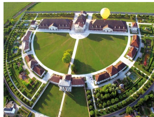
Fig.4. Saline royale d'Arc-et-Senans

Le Doubs recèle encore bien d'autres richesses de toutes époques. Ainsi à Mandeuve se dévoilent les vestiges imposants d'un vaste théâtre gallo-romain. Les châteaux de Cléron et de Belvoir plongent le visiteur au temps des chevaliers du Moyen-Âge, tandis que ceux de Moncley ou Vaire-le-Grand témoignent de l'architecture du XVIII-e siècle. L'église du Sacré-Cœur d'Audincourt compte parmi les édifices majeurs de l'art sacré du XX-e siècle tttttttt .