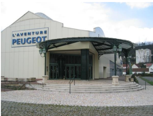
Fig.3. Musée de l'Aventure Peugeot à Sochaux ( www.musee-peugeot.com )