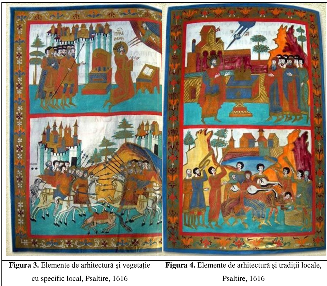
Figura 3. Elemente de arhitectură și vegetație cu specific local, Psaltire, 1616