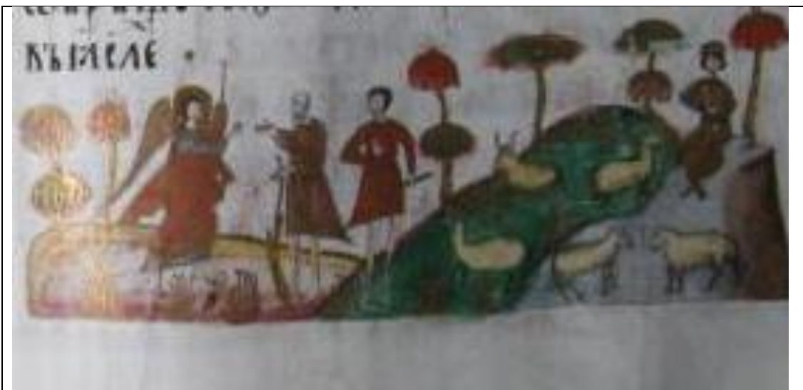
Figura 2. Detaliu Manuscris Sucevița 24

Elementele cu specific național întâlnite în Tetraevangheliarul Sucevița 24 sunt: brazii, cetățile cu turnuri și creneluri moldovenești amintind de incintele fortificate ale mănăstirilor moldovenești, precum și aspecte cu caracter local ale vieții cotidiene, care făceau parte integrantă din orizontul pictorului respectiv; ciobanul cântând din fluier alături de oile sale, lucrătorii viei cu unelte specifice acestei activități (sapă, hârleț, etc.) 6 (Figura 2).