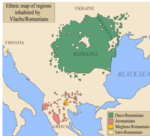
Figura 2: Mappa dei dialetti protoromeni 10